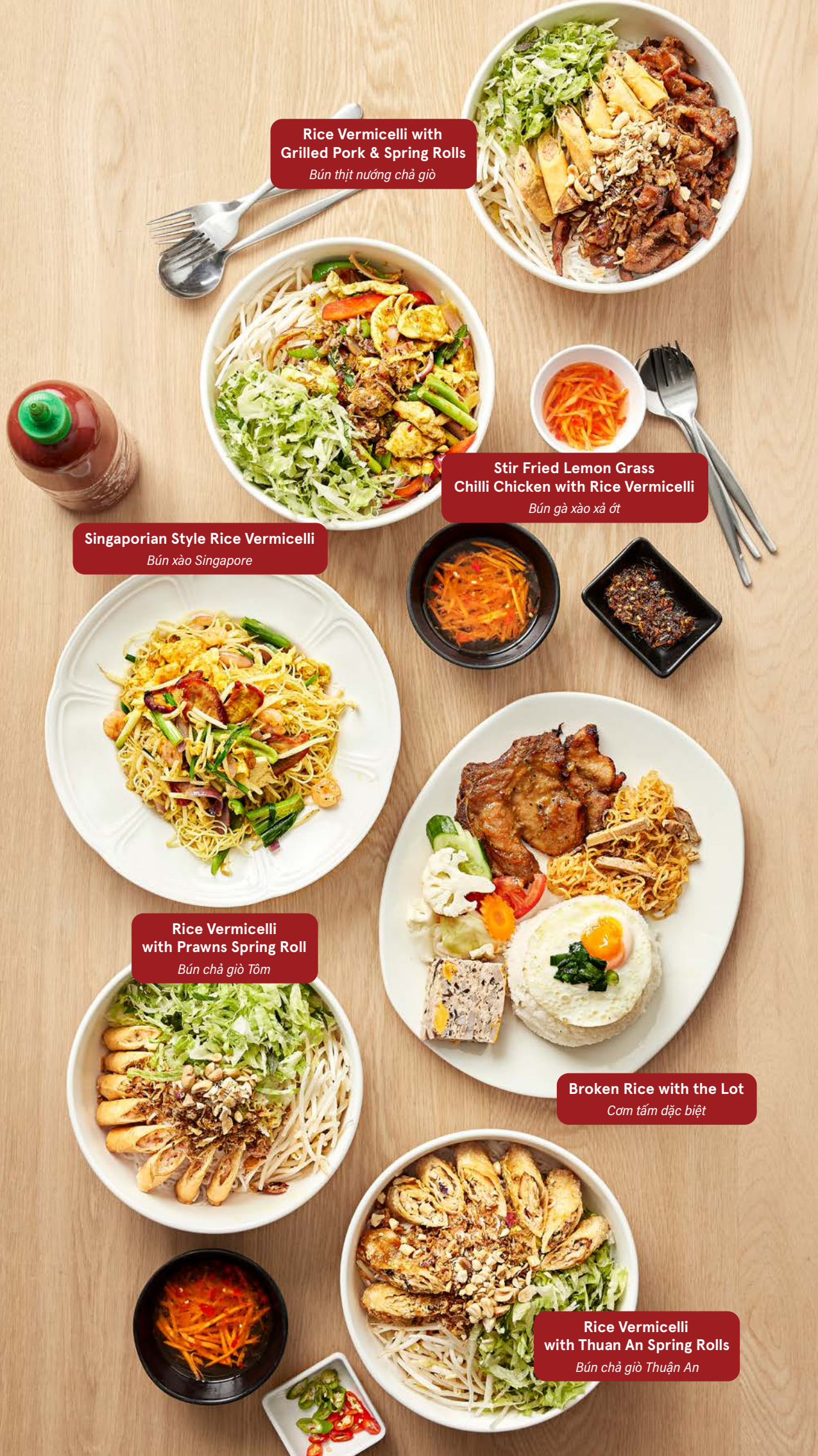
Rice Vermicelli with Grilled Pork & Spring Rolls Bún thịt nướng chả giò