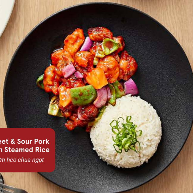
Sweet & Sour Pork with Steamed Rice cơm heo chua ngọt