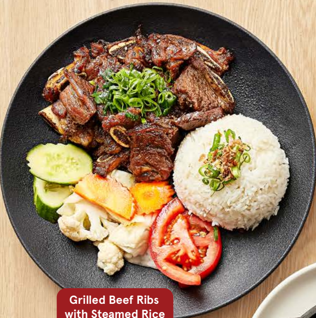
Grilled Beef Ribs with Steamed Rice cơm Sườn bò nướng