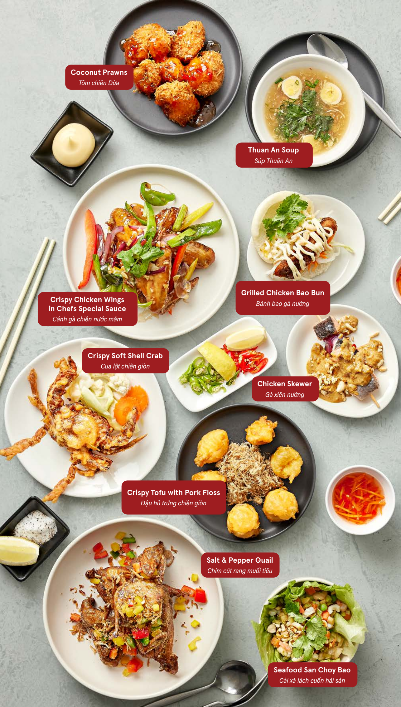
Coconut Prawns Tôm chiên Dừa