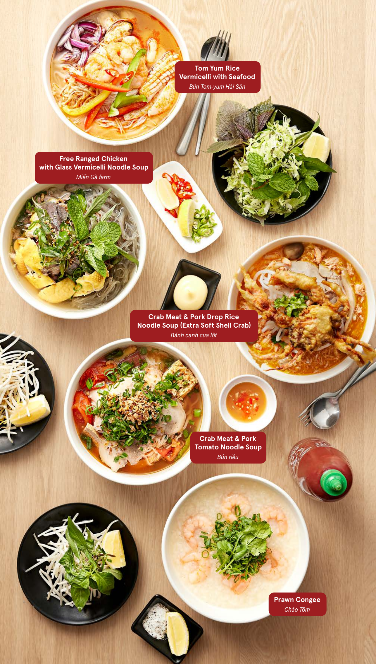
Tom Yum Rice Vermicelli with Seafood Bún Tom-yum Hải Sản