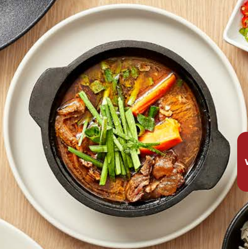
Beef Casserole with Steamed Rice cơm Bò kho