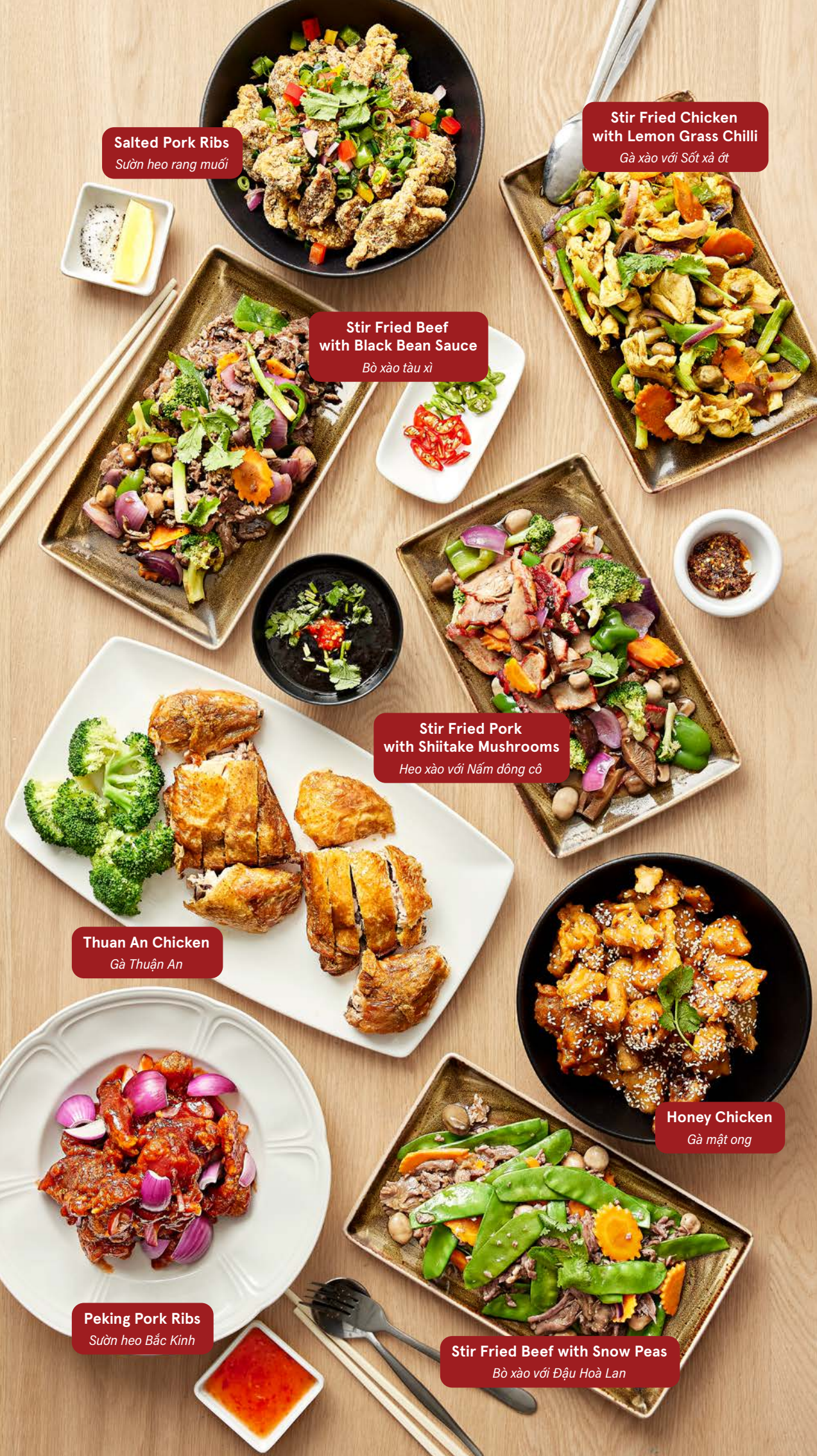
Salted Pork Ribs Sườn heo rang muối