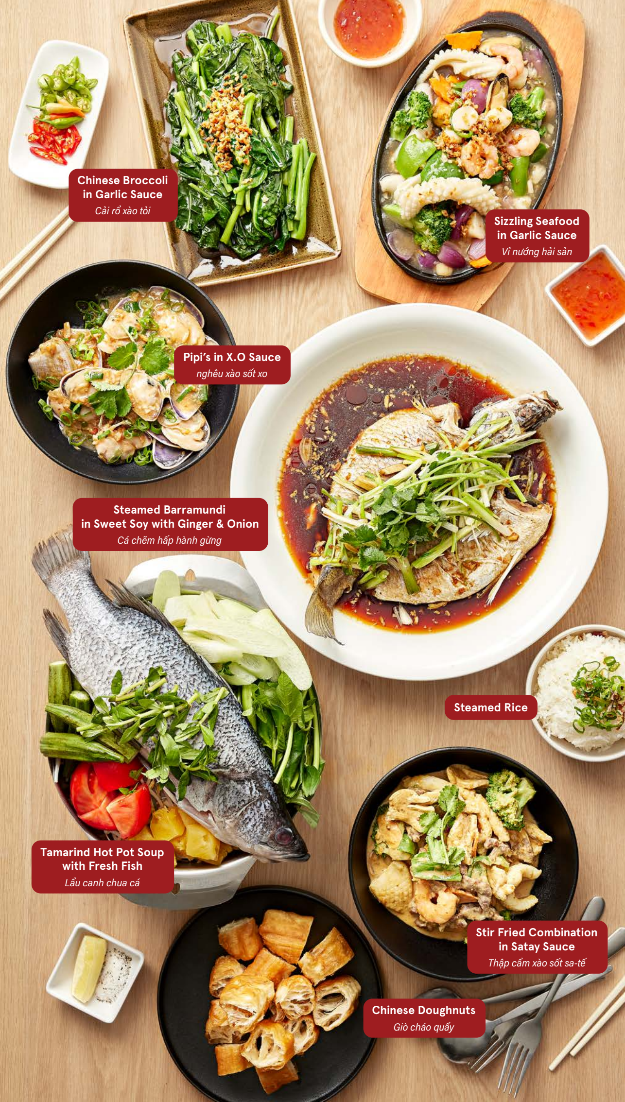
Chinese Broccoli in Garlic Sauce Cải rổ xào tỏi