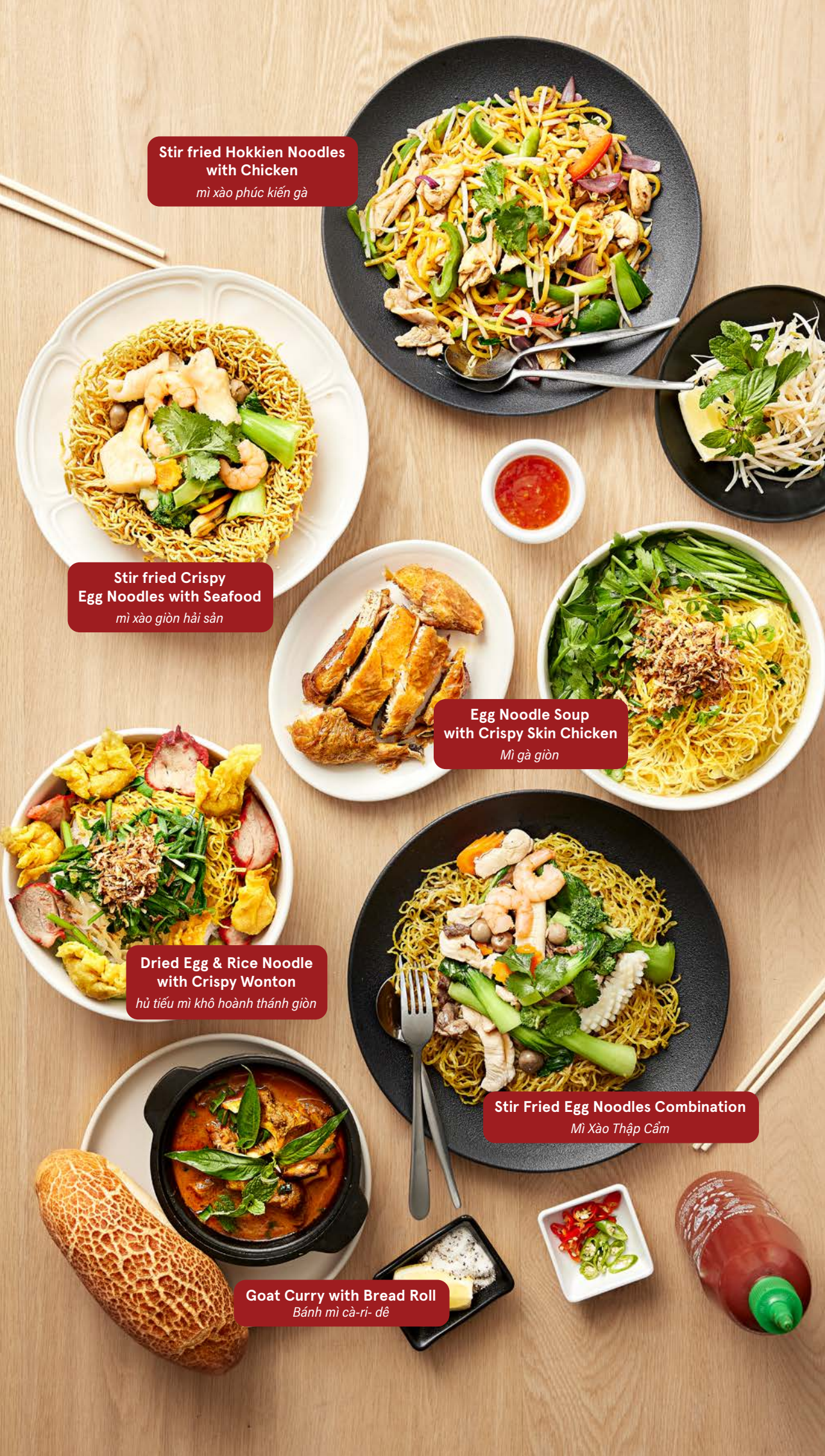
Stir fried Hokkien Noodles with Chicken mì xào phúc kiến gà