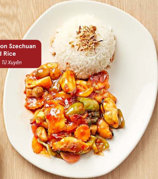
Stir Fried Combination Szechuan with Steamed Rice cơm xao Thập Cẩm Tứ Xuyên