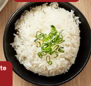
Combination Egg Omelette with Steamed Rice cơm Trứng chiên thập cẩm