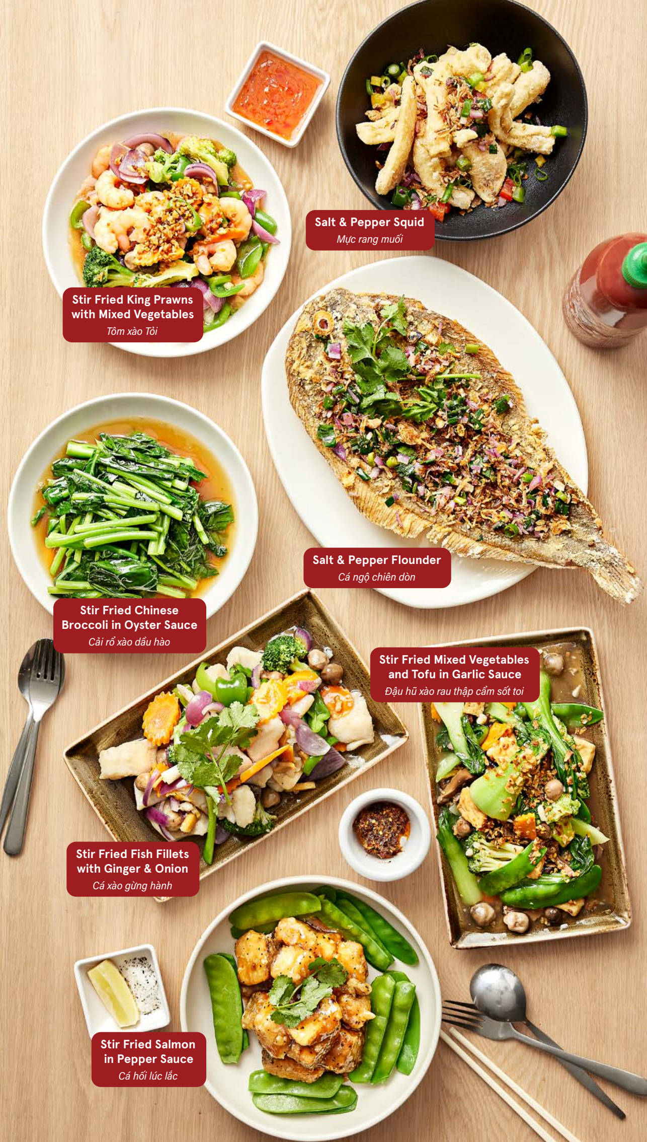
Stir Fried King Prawns with Mixed Vegetables Tôm xào tỏi