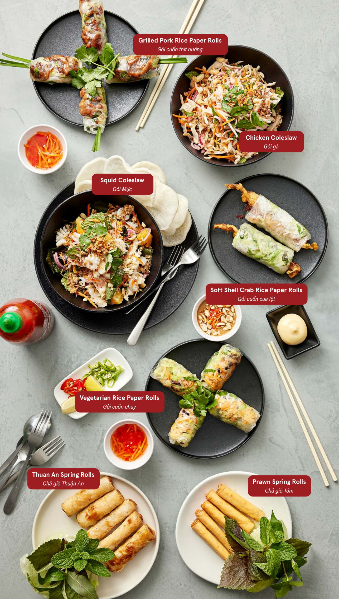
Grilled Pork Rice Paper Rolls Gỏi cuốn thịt nướng