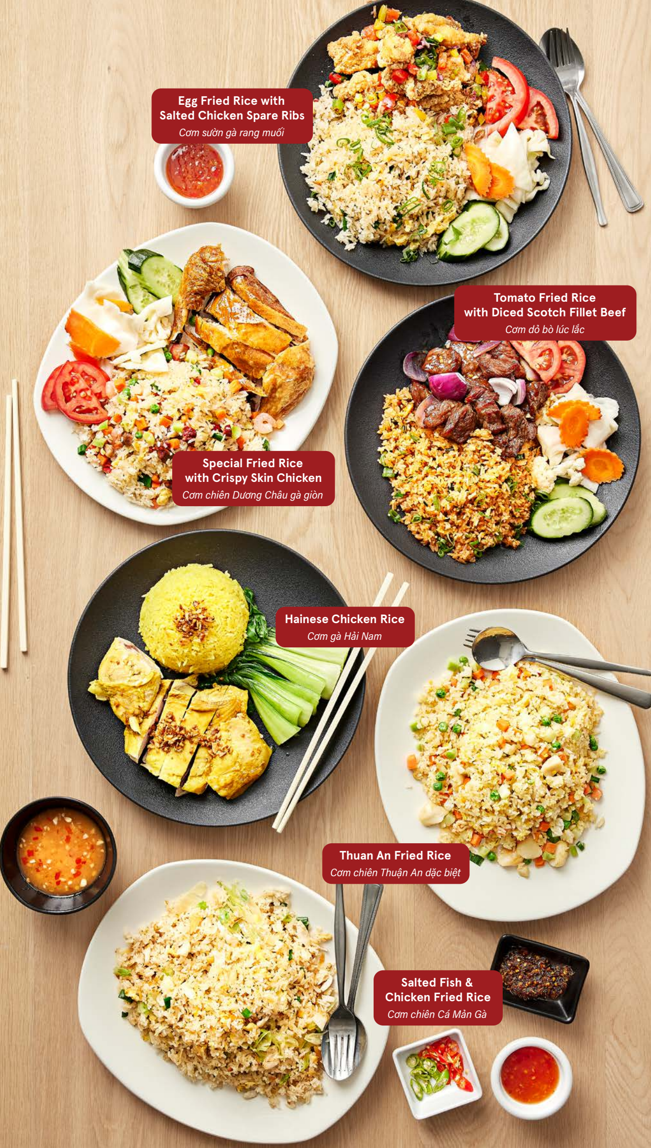
Egg Fried Rice with Salted Chicken Spare Ribs Cơm sườn gà rang muối